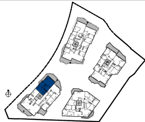
TABLEAU DE SURFACES :