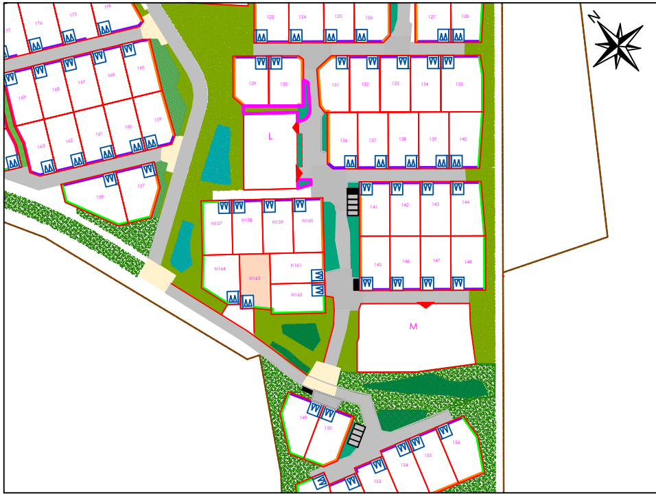
PLAN DE VENTE PROVISOIRE