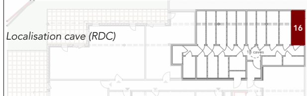
Plan en version accessible aux P.M.R.

La disposition des équipements est donnée à titre indicatif. La société se réserve la possibilité d'apporter les modifications dues à des impératifs administratifs ou techniques.