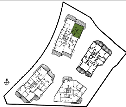
TABLEAU DE SURFACES :